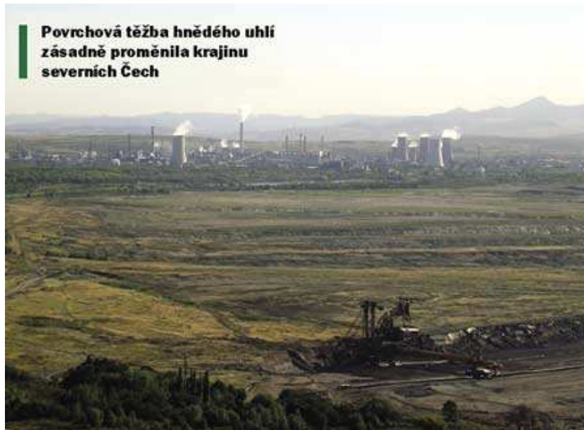
Krajinu ničí uhelné elektrárny

Někomu turbíny vadí, jinému se líbí. Harmonická krajina, jak ji vnímáme, je založena na rovnováze působení člověka a přírody. A větrná elektrárna je často hodnocena jako moderní prvek, který krajinu oživuje: symbol čisté, nevyčerpatelné a dynamické energie větru.